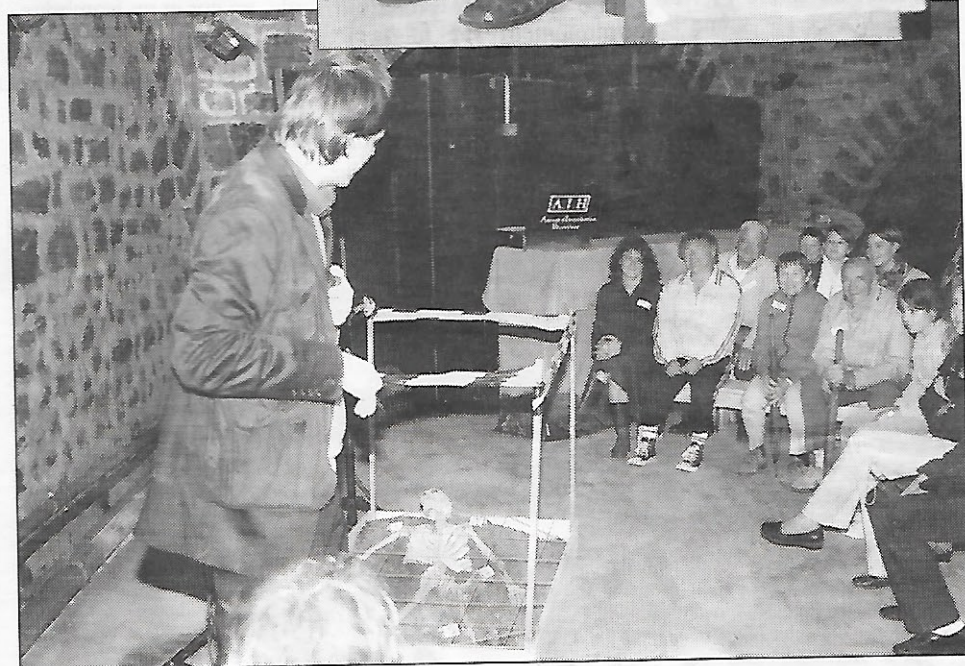
Au cœur d'une intrigue policière...